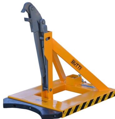
ΔΙΑΣΤΑΣΕΙΣ ΘΕΣΕΩΝ ΓΙΑ ΚΛΑΡΚ